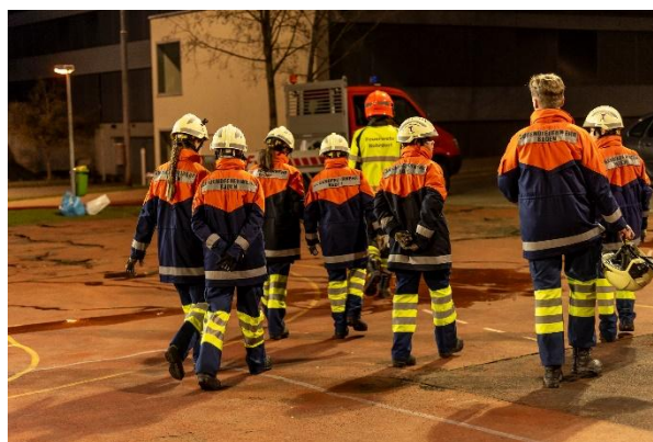
Übung mit der Jugendfeuerwehr Baden

Die Absturzsicherungsgruppe durfte eine Spezialübung in einer Industriehalle in Zofingen durchführen, zusammen mit der entsprechenden Spezialistengruppe der Feuerwehr Lenzburg.