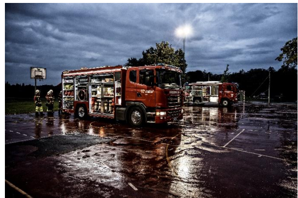
Tanklöschfahrzeuge Rohrdorf (vorne) und Fislisbach

Die Bestandssituation blieb im Jahr 2025 weiterhin stabil und innerhalb der von der AGV vorgesehenen Toleranz. Einige Mitglieder traten infolge Wegzugs oder altershalber aus der Feuerwehr Rohrdorf aus. Wer Interesse daran hat, aktiven Feuerwehrdienst zu leisten, darf sich gerne beim Feuerwehrkommando oder bei jedem Angehörigen der Feuerwehr melden.