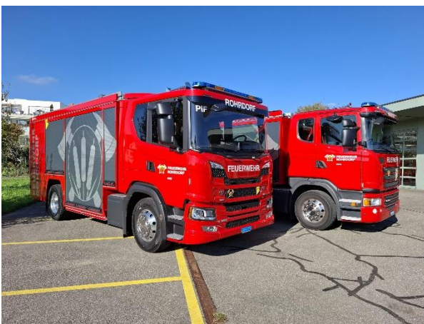
Neues Pionierfahrzeug (vorne) und Tanklöschfahrzeug

Die offizielle Fahrzeugeinweihung erfolgt anlässlich der Publikumsübung 2026 am 12. Juni. Die Feuerwehr Rohrdorf freut sich über zahlreiche Zuschauer und Gäste.