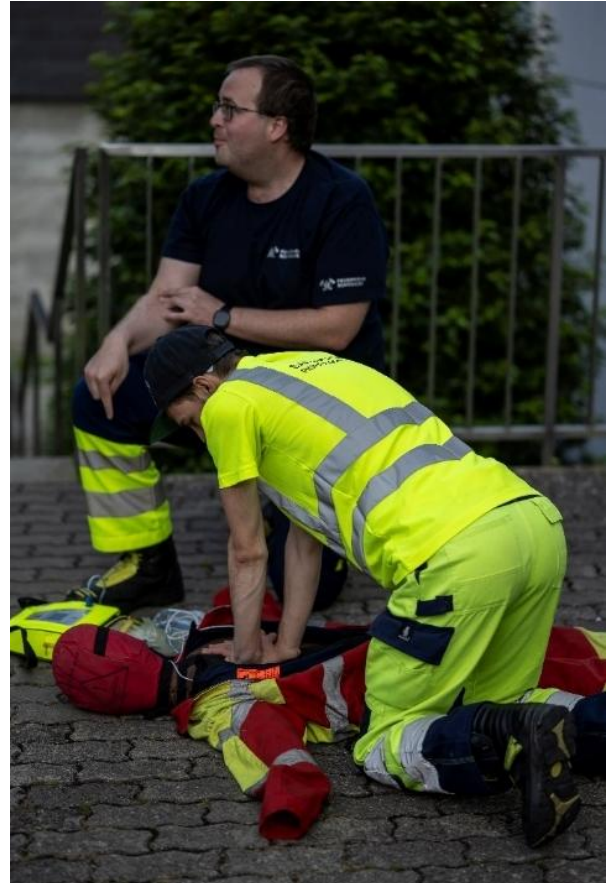
Bilder diverser Übungen 2025