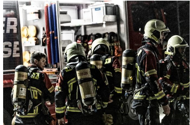
Atemschutzübung in Fislisbach

Da die Feuerwehr Fislisbach das gleiche Notalarmierungssystem beschafft hat, kann nun auch im Krisenfall (Ausfall Strom und/oder Telekommunikation) auf eine autarke, gegenseitige Alarmierung gesetzt werden.