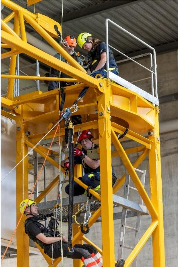
Übung Absturzsicherung Spezial