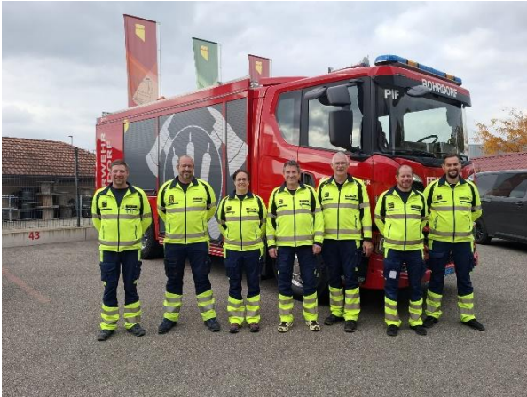
Neues Pionierfahrzeug mit der Beschaffungskommission