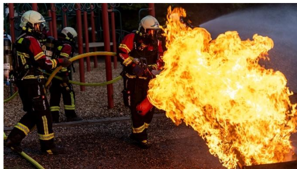
Atemschutzübung mit der Stützpunktfeuerwehr Baden

Diverse Übungen in allen Fachgebieten wurden zusammen mit der Feuerwehr Fislisbach durchgeführt. Zusätzlich war die Jugendfeuerwehr Baden für eine Übung zu Gast, wie auch der Atemschutz der Feuerwehr Baden und die Alarmsamariter des Samaritervereins Rohrdorf und Umgebung – ganz nach dem Motto KKK: «In Krisen Köpfe kennen».