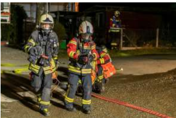
Gemeinsame Atemschutzübung mit der Feuerwehr Fislisbach

Startete der Übungs- und Ausbildungsbetrieb noch im Zeichen der Covid-Pandemie, hat sich diesbezüglich die Lage Anfangs 2022 sehr schnell normalisiert. Das Jahresprogramm konnte erstmals seit 2019 wieder vollumfänglich und wie geplant durchgeführt werden. Wichtig für die gegenseitige Einsatzunterstützung war insbesondere, dass wieder gemeinsame Übungen mit der Partner-Feuerwehr Fislisbach durchgeführt werden konnten.