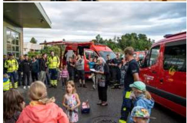
Publikumsübung 2022 inkl. Fahrzeugeinweihung

Die gesamte Mannschaft durfte an einem Samstag intensiv die Thematik «Industriebrandbekämpfung» trainieren. Dazu war sie zu Gast bei der Chemiewehrschule in Zofingen. Jeder Angehörige der Feuer-