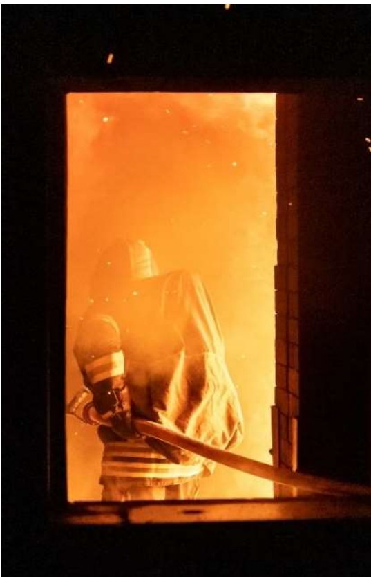
Atemschutzeinsatz-Training im Brandhaus AGV

Beschaffungstechnisches Highlight war die Neuanschaffung einer Motorspritze mit zugehörigem Anhänger. Diese löste zwei Motorspritzen aus den Sechzigerjahren ab. Weniger erfolgreich verlief dagegen die geplante Neuanschaffung mit einer modernen Brandschutzbekleidung. Diese ist dringend notwendig, da die aktuelle Ausrüstung buchstäblich auseinanderfällt. Es war geplant, diesbezüglich auf eine Lösung im Mietmodell zu setzen, welche von der Aargauischen Gebäudeversicherung geplant war. Aufgrund einer Submissionsbeschwerde wird sich diese Lösung um Jahre verzögern. Daher wird die Feuerwehr Rohrdorf nun im Jahr 2023 nochmals eine eigene Beschaffung tätigen.