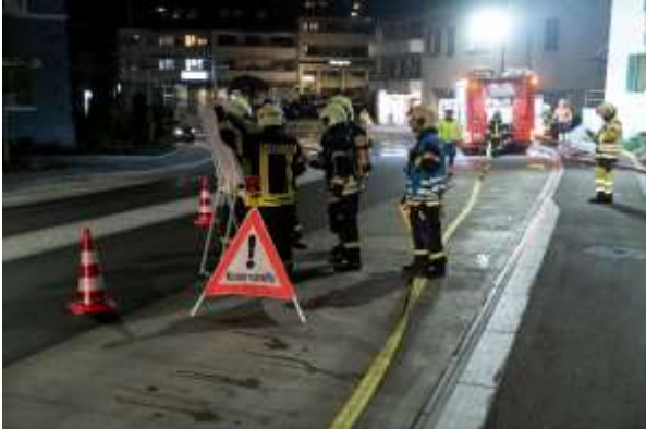
Einsatzübung in Oberrohrdorf

Die Bestandssituation blieb im Jahr 2022 weiterhin stabil und innerhalb der von der AGV vorgesehenen Toleranz. Einige Mitglieder traten in Folge Wegzugs aus der Feuerwehr Rohrdorf aus und Ende Jahr mussten auch einige langgediente Kollegen und Kolleginnen verabschiedet werden, welche altershalber aufhörten. Der Neurekrutierungsabend 2022 verlief erfolgreich, so dass die entstandenen Lücken wieder gefüllt werden konnten. Wer Interesse hat, aktiven Feuerwehrdienst zu leisten, darf sich gerne beim Feuerwehrkommando oder bei jedem Angehörigen der Feuerwehr melden.