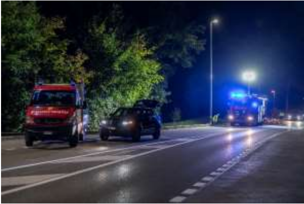
Einsatzübung Verkehr in Niederrohrdorf

Im Berichtsjahr musste die Feuerwehr Rohrdorf zu 15 (29) Einsätzen ausrücken. Damit bewegte sich die Anzahl Einsätze auf einem vergleichsweise sehr tiefen Niveau und auch Grossereignisse blieben glücklicherweise aus.