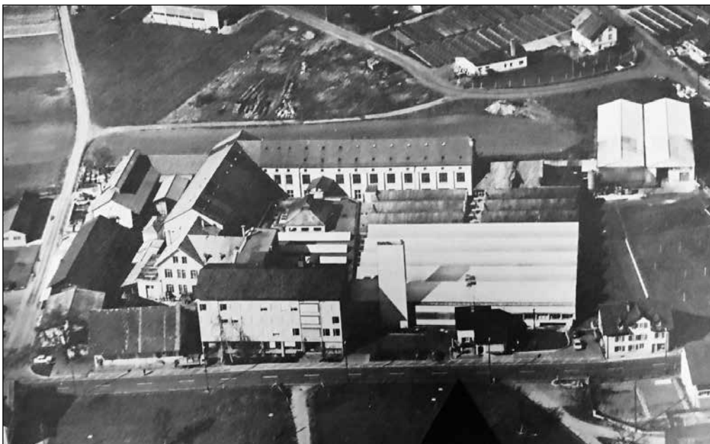
Fabrikareal an der Mellingerstrasse in Niederrohrdorf um 1975

Kastor Egloff , ein Pionier der Metallindustrie, wurde 1820 in Niederrohrdorf als sechstes von zehn Kindern in einer armen Kleinbauernfamilie geboren. Bereits im Alter von sechs Jahren waren die Eltern erleichtert, den Knaben in fremde Obhut geben zu können!