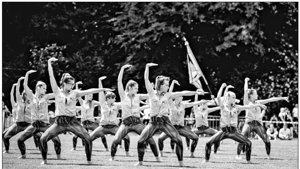
Die Aargauermeister Gymnastik Kleinfeld überzeugten mit ihrem gelungenen Programm.