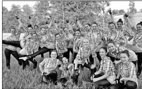
Strahlende Gesichter nach einem gelungenen Wettkampf in Vordemwald

Der Turnibutz-Cup war der zweite Vorbereitungswettkampf für das Teensgym vor den Aargauer Meisterschaften, die am 3. Juni in Gränichen stattfanden. Nachdem die Saison erfolgreich mit einer tollen Note von 9.30 in Rothrist eröffnet wurde, freuten sich alle auf die Premiere in Vordemwald. Insgesamt waren acht Teams auf dem Rasen am Start. Spannung war also angesagt. Die Girls zeigten wieder eine solide Leistung und ernteten viel Applaus vom Publikum am Feldrand. Bis zum Rangverlesen blieb genug Zeit, um sich in der Festwirtschaft verwöhnen zu lassen und die anderen Vereine anzufeuern. Mit der Höchstnote des Abends in der Gymnas-