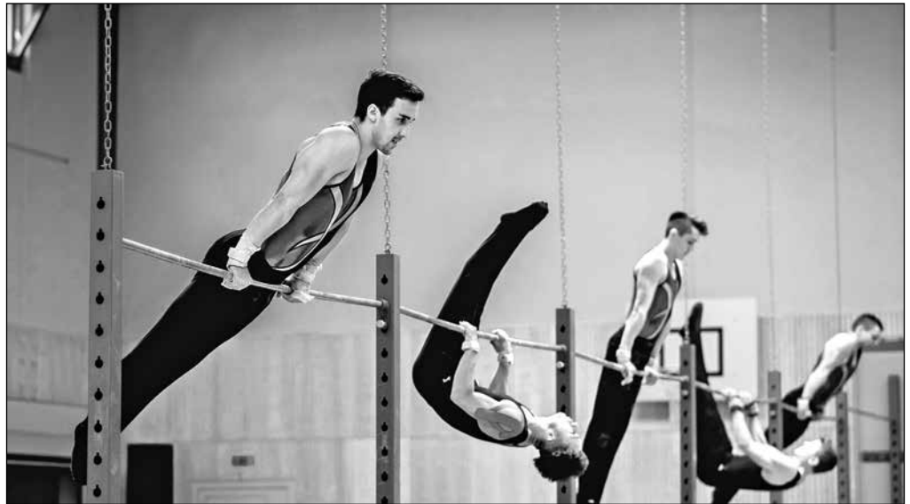
Die frischgebackenen Aargauermeister im Reckturnen verteidigten ihren Titel vom Vorjahr.

Am Samstag eröffnete die Ringsektion den Wettkampftag der Erwachsenen mit den Vorrunden. Schlag auf Schlag konnten alle fünf Disziplinen des Vereins zufriedenstellende Leistungen erturnen und ertanzen. Die Ringsektion, das Gym Dance, die Sprungsektion und die Herren vom Reck schafften allesamt den Einzug in den Final. Die Team Aerobic Gruppe verpasste mit dem 5. Schlussrang den Einzug in den Final nur knapp, konnte jedoch mit seiner Leistung zufrieden sein. Die Finalrunde verlief ausgezeichnet und beim Rangverlesen kullerten dann auch ein paar Freudentränen über die strahlenden Gesichter der Sieger. Die Herren vom Reck konnten ihre konstante Leistung abrufen und verteidigten den Kantonalmeistertitel mit der Note 9.80. Ebenfalls Aargauermeister dürfen sich die Damen vom Gym Dance nennen. Die grosse Überraschung kam beim Sprung. Mit der Note 9.62 reichte es auf den zweiten Schlussrang hinter dem STV Wettingen und vor dem STV Neuenhof. Auch die Ringsektion gewann stolz mit der Note 9.62 knapp vor dem STV Niederwil den Vizemeistertitel.