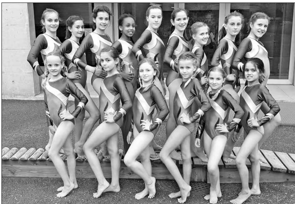
Viele Auszeichnungen gab es für die Turnerinnen in den Kategorien 3 und 4.

Herzliche Gratulation an alle Turnerinnen für die gezeigten Leistungen!