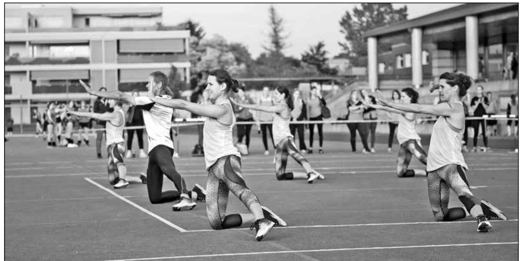
Über den ersten Platz durften sich auch die Frauen vom Gym Dance freuen.

Wir sind auch für Drucksachen Ihr Partner!