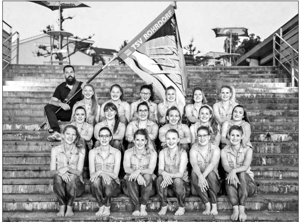
Mit dem neuen Programm landete die Gruppe Team Aerobic auf Platz 1 in ihrer Kategorie.