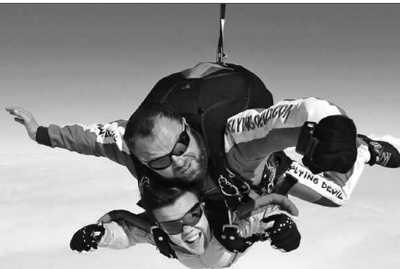
Diese Anzeige ist für die Stiftung Kinderhilfe Sternschnuppe kostenlos.

CH47 0900 0000 8002 0400 1 www.sternschnuppe.ch