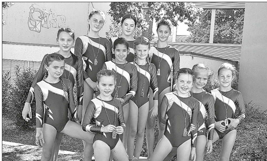
Turnerinnen der Kategorie 1 und 4