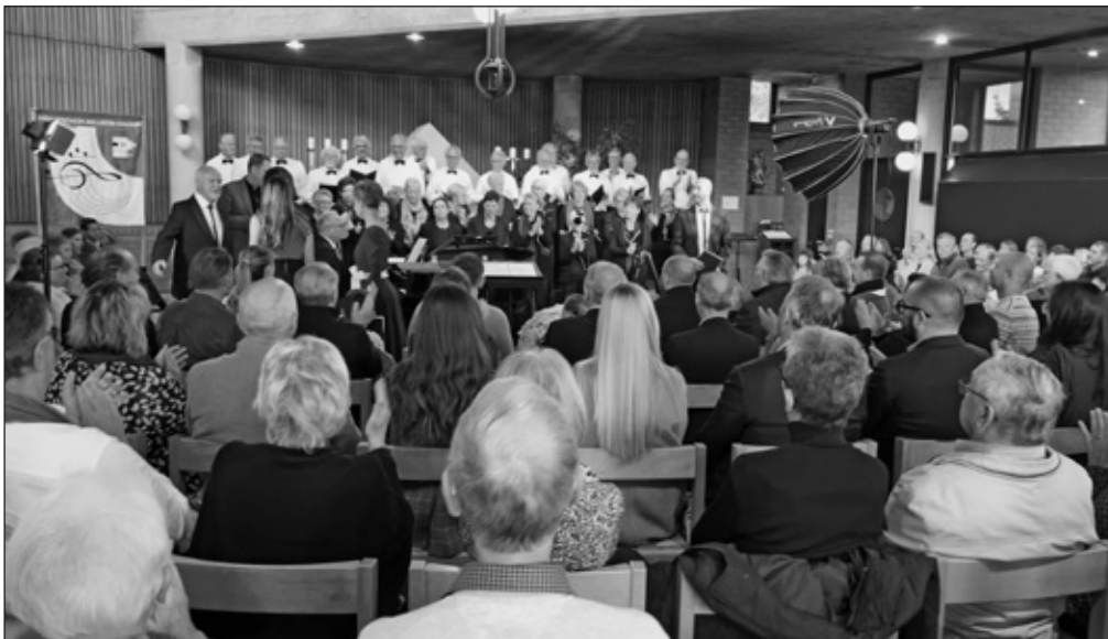
Das Abschluss-Konzert war ein voller Erfolg.