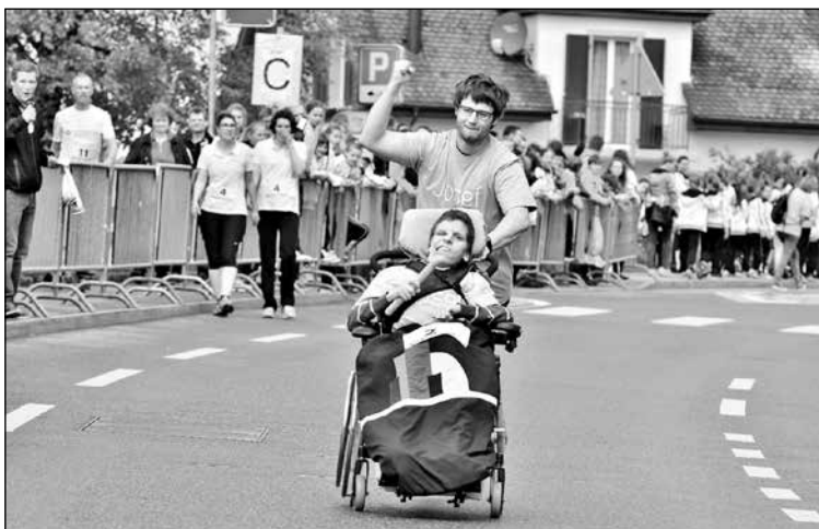
Am Quer gehören Menschen mit Handicap dazu, ohne Wenn und Aber.