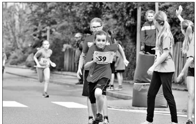
Den Kindern Spass an Bewegung und Sport vermitteln, auch das Ziel des Laufevents.

Werbung bringt Erfolg. Am richtigen Ort noch mehr! – Berg-Post