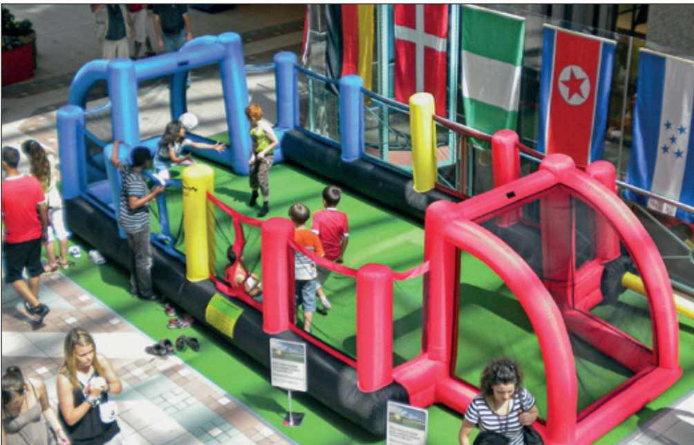
Dieser Kinder-Fussballplatz steht am Märtkafi.

Es ist eine wöchentliche Tradition am Rohrdorferberg (und rundum): Das Märtkafi in Niederrohrdorf. Hier trifft man sich, Samstag für Samstag jeweils am Vormittag, um neben Kaffee und Gipfeli ein kleines Plauderstündchen innerhalb der hiesigen Bevölkerung zu geniessen.