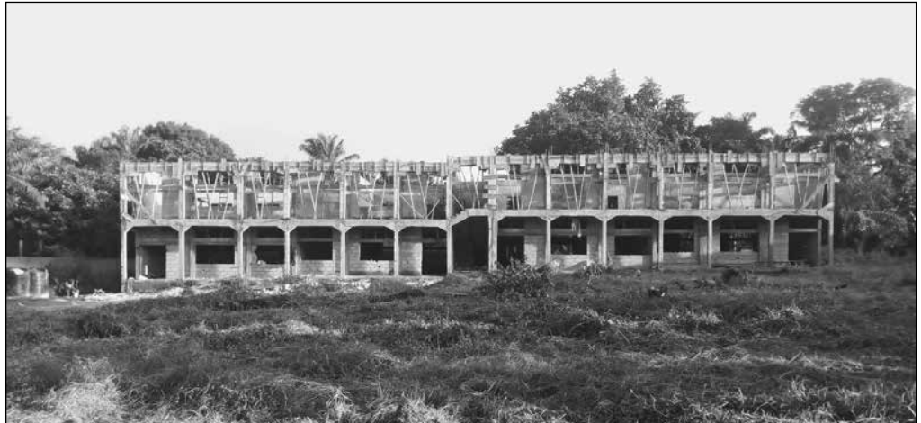
Pestalozzi-Sekundarschule: Block 1 mit acht Schulzimmern

Pfarrer Amuluche leitet in Nigeria, nebst seiner riesigen Aufgabe als Bischofsvikar, den