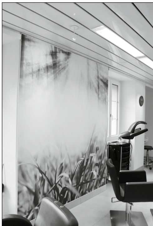
Strahlender Sonnenschein – 365 Tage lang Frühling im Salon (links). Die «Barber-Ecke» für den modernen Herrn. Die umgebauten Räumlichkeiten sind hell und einladend freundlich.

Die «neuen» Räumlichkeiten lassen sich sehen. In Ab- und Rücksprache mit dem Team wurden diese geschmackvoll eingerichtet. Wände wurden gestrichen und helle Steinbodenplatten verlegt. Die kompletten Anlagen sind ebenfalls alle ausgewechselt und modernisiert. Ein einladendes Welcome-Desk fällt sofort auf und auch die Herren-Abteilung (Barber-Ecke) wurde entsprechend hergerichtet. Das Mobiliar ist in einem sympathischen Crème-Ecru gehalten und dadurch erscheinen die Räumlichkeiten noch offener. Die Stromversorgung für die entsprechenden Apparate wird «von oben geliefert». Die Anschlüsse befinden sich nicht mehr statisch an einem Ort, sondern durch die individuelle Stromzufuhr können Bedienungsplätze und Behandlungssessel flexibel umgestellt werden. Ein zusätzlicher bequemer Service, findet Notter. Im Untergeschoss befindet sich ein Nagelstudio, welches auch einer sanften Renovation unterzogen wurde. Für die Umbau- und Renovationsarbei-