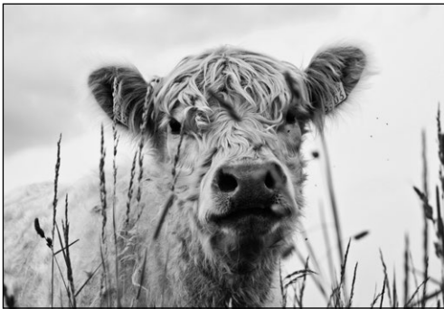
Darf ich vorstellen? Ich bin ein Galloway Rind.