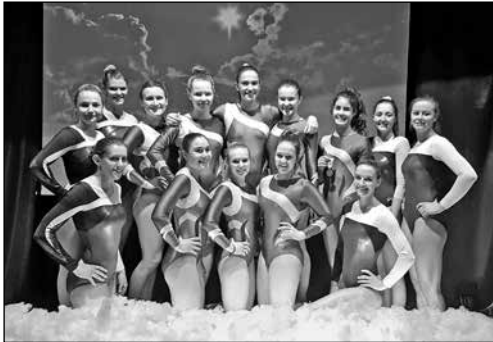
Die Geräteturnerinnen des TSV Rohrdorf freuten sich über den Erfolg in Gränichen.