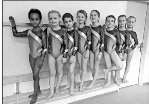
Auch der Geräteturn-Nachwuchs überzeugte in Gränichen.

Am Wochenende vom 5. und 6. Mai starteten beim Grätü-Cup in der Turnhalle Gränichen trotz schönstem Sommerwetter über 1000 Geräteturnerinnen. Mit diesem riesigen Teilnehmerfeld ist der Grätü-Cup der grösste Geräteturnanlass im Kanton Aargau. Die grosse Teilnehmerzahl widerspiegelt das grosse Interesse an dieser Sportart, die viel Selbstdisziplin, Mut und einen starken Willen erfordert. Der TSV Rohrdorf war mit insgesamt 56 Turnerinnen am Start. Davon gewannen 37 Tur-