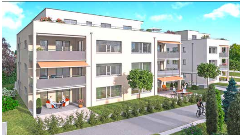
Visualisierung der Überbauung «Im Baumgarten». Sie ist ideal gelegen bei der Bushaltestelle Welschland.

Verkauf und Erstvermietung: Markstein AG Haselstrasse 16 5401 Baden Tel. 056 203 50 50 www.imbaumgarten.com