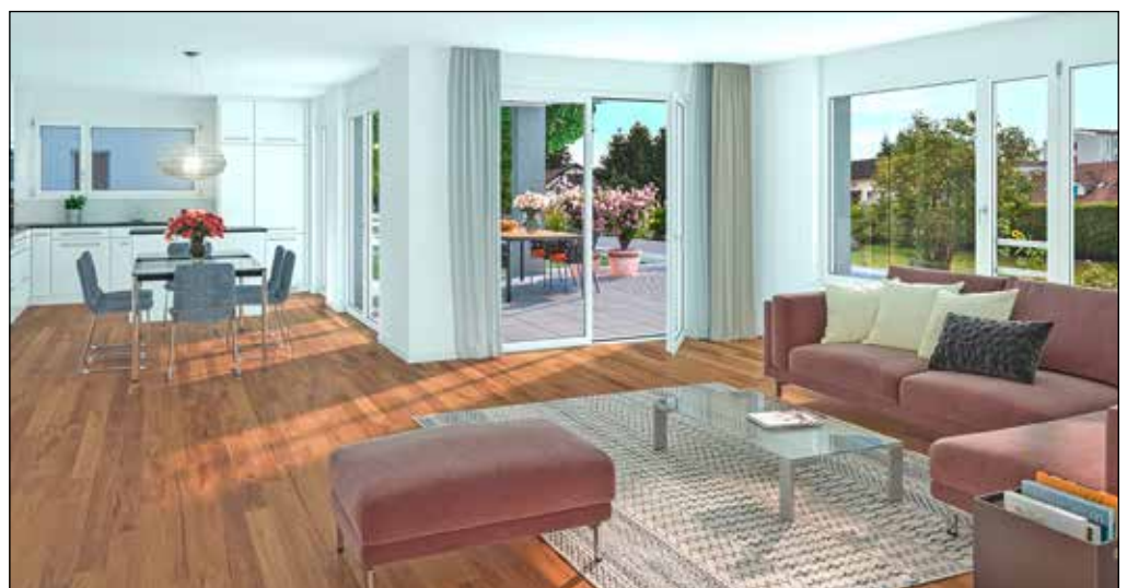
Blick ins geräumige Wohnzimmer mit Esstisch und Küche (hinten)