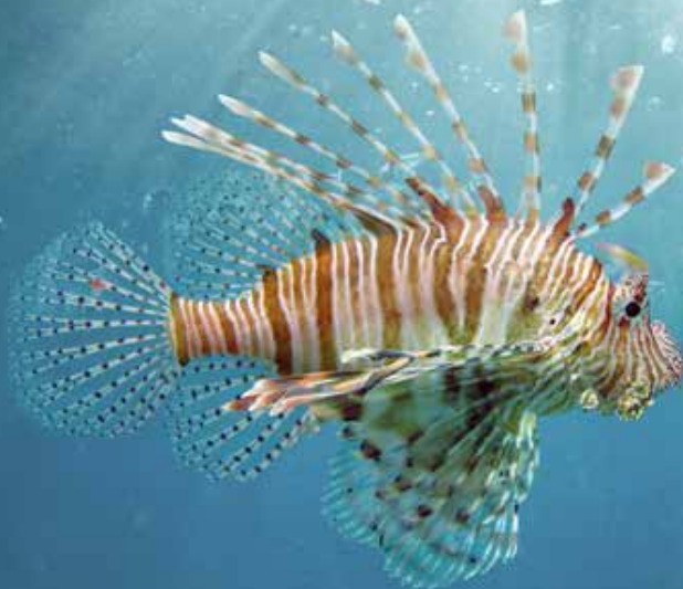
Lebenserwartung: 4 Jahre

Druckerei Nüssli AG Bahnhofstrasse 37 5507 Mellingen Tel. 056 491 13 28 Fax Druckerei 056 470 66 75 Fax Redaktion Reussbote 056 491 18 30