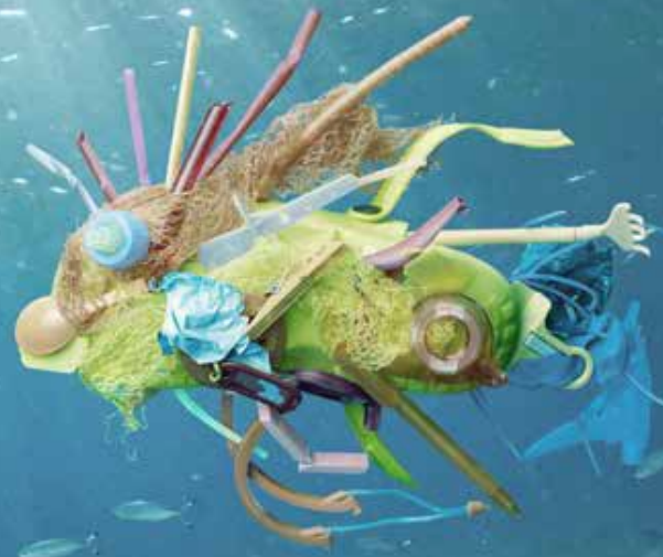
Lebenserwartung: 400 Jahre

Es dauert Hunderte von Jahren, bis sich Plastikabfall zersetzt. Unsere Ozeane drohen zu gigantischen Mülldeponien zu werden – mit tödlichen Folgen für die Meeresbewohner.